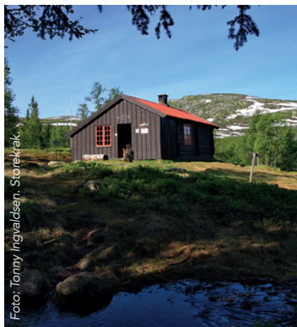
Storekrak.