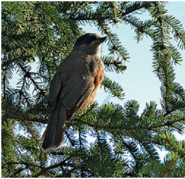
Top: Siberian jay, middle: Eurasian nuthatch, bottom: Great spotted woodpecker

Eine private Waldstraße (ge-sperrt für Verkehr) führt von hier zur DNT-Hütte Storekrak. Folgen Sie ihr zu Fuß oder per Fahrrad. Nach der Überquerung der Øvre Bogbrua (Schild) teilt sich der Weg. Folgen Sie dem linken Pfad in Richtung Vassfarkoia für ca. 2–3 km bis auf 1200 m Höhe (der Ørneflagg liegt jetzt rechter Hand), wo ein ausgeschilderter, aber unmarkierter Pfad nach rechts abzweigt. Dieser führt in einem nördlichen Bogen zum Gipfel. Großartige Aussicht.